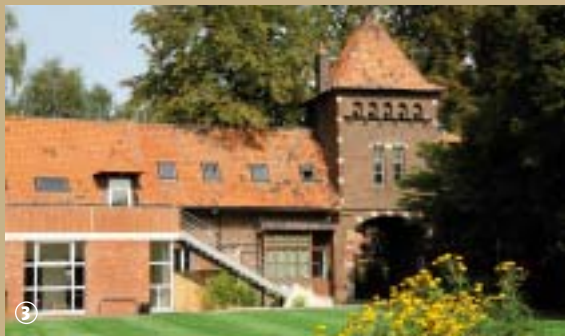
Institut de Genech

L'institut de Genech n'est pas une école comme les autres. Mais pourquoi donc me direz-vous ?