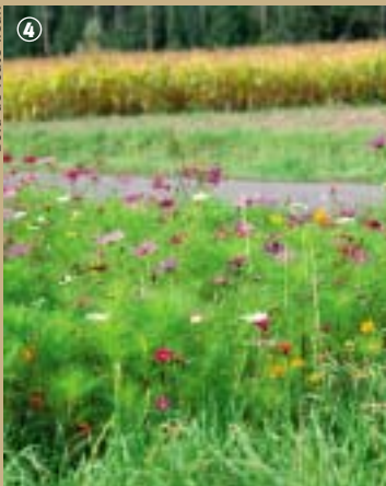
Bord de route fleuri